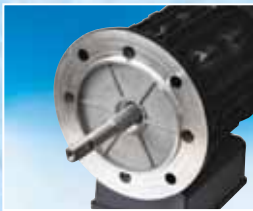
AISI 316 paslanmaz çelik motor mili