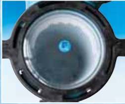
Ön filtre kapağında geniş ve görünüm