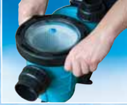
Kolay açılır kapak