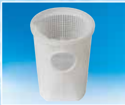
Geniş hacimli sepet