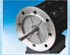
AISI 316 paslanmaz çelik motor mili