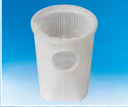
Geniş hacimli sepet