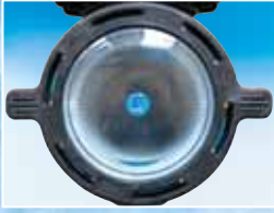
Ön filtre kapağında geniş ve net görünüm