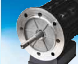
AISI 316 paslanmaz çelik motor mili