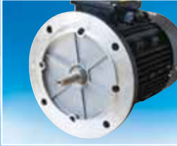
AISI 316 paslanmaz çelik motor mili