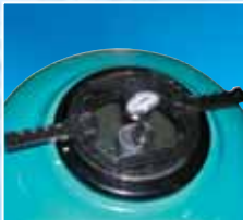
Şeffaf kapak - OPSİYONEL