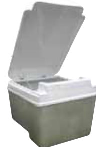
Kabin II: Üstten Tek Kapak ve Mekanik Kapak Desteği