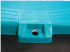
Emniyet için Kilit Takma imkanı