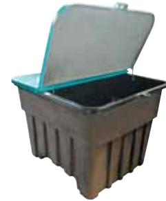
Kabin I: Çift Kanatlı Kapak ve Mekanik Kapak Desteği